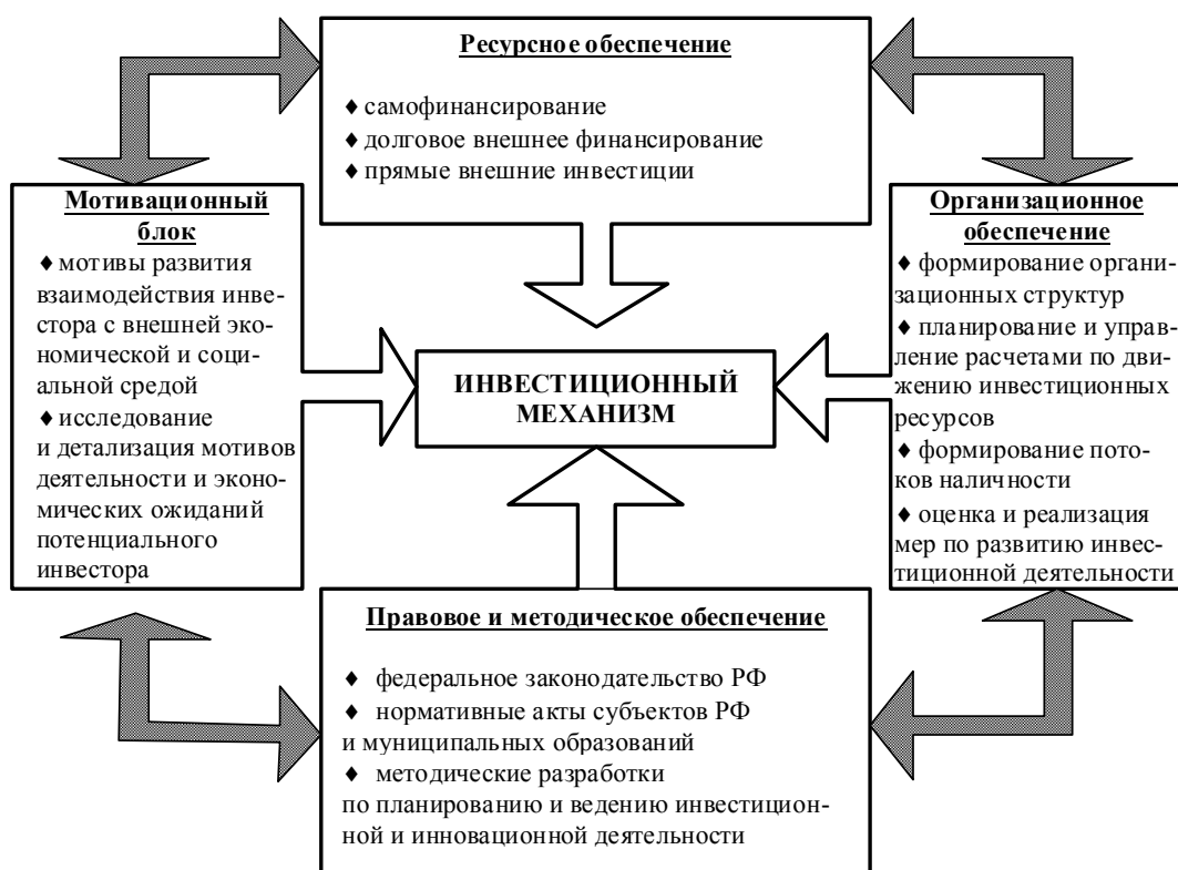
Рис. Формирование инвестиционного механизма и взаимодействие его элементов

Инвестиционный механизм включает в себя следующие структурные составляющие (см. рисунок).